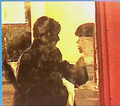
El beso de la mujer araña, Manuel Puig